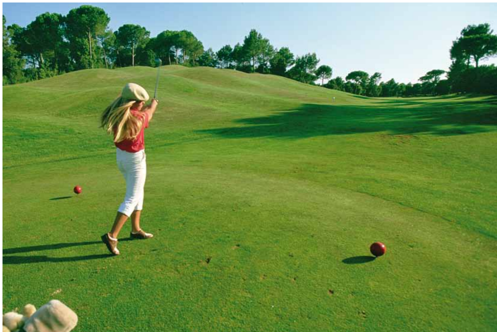
Välskötta golfbanor ligger på rad längs Rivieran. Här Cannes-Mougins banan.

Efter en tidig frukost står jag på golfbanan. Luften är hög och klar och solen strålar från en blå himmel. I den tidiga morgonen hörs fåglar kvittra och humlor surra. Nedanför kullarna ligger Monte-Carlo, furstendömet Monaco och i fjärran glittrar Medelhavet. Côte d'Azur erbjuder verkligen livskvalité av högsta klass. Charmiga medeltidsstäder att upptäcka, underbara små boutiquehotell och fantastiska gourmetrestauranger. Längs Rivieran har 36 av dem belönats med Guide Michelin stjärnor. Besök legendariska lyxhotell, härliga stränder och lyxiga Spa. Man kan ägna sig åt superlyxig shopping och Jetsetliv om man vill och har råd. Men här finns det också enklare men utsökta platser att upptäcka och inte minst spännande utmaningar på 20-talet golfbanor från Monaco till St Tropez.