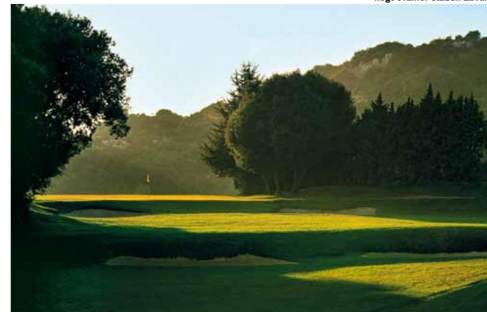
Monte Carlo Golf Resort. Banan ligger högt ovanför staden La Turbie.