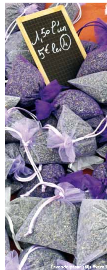
Lavendelpåsar säljs överallt.