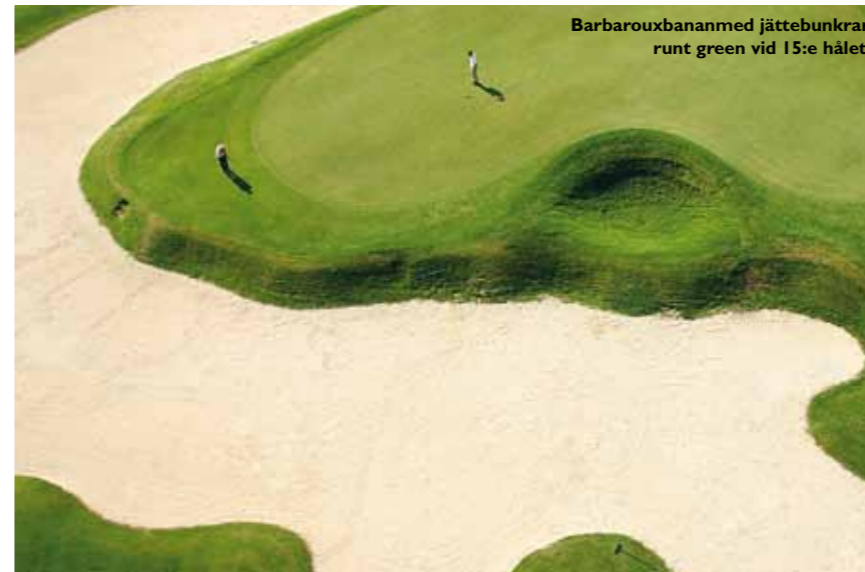
Barbarouxbanan med jättekunrar runt green vid 15:e hålet.

En av många duktiga golfspelare rekommenderar parkbanorna Opio-Valbonne, Old Course i Mandelieu, Saint Donat och Sainte-Andreol. Out of Bounds har paketresor till både Sainte-Andreol, Saint Donat och Barbaroux banan längre upp i bergen. www.outofbounds.se