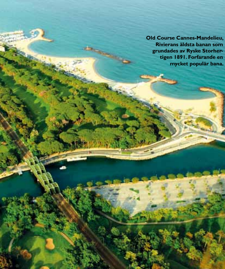
Old Course Cannes-Mandelieu, Rivierans äldsta banan som grundades av Ryske Storhertigen 1891. Forfarande en mycket populär bana.

öppen för andra spelare med max hep 28. Det finns 25 hotellsviter, härligt spa och pool. Greenfee är 200 Euro under veckosluten men för hotellgäster blir det 150 Euro och golfbil ingår.