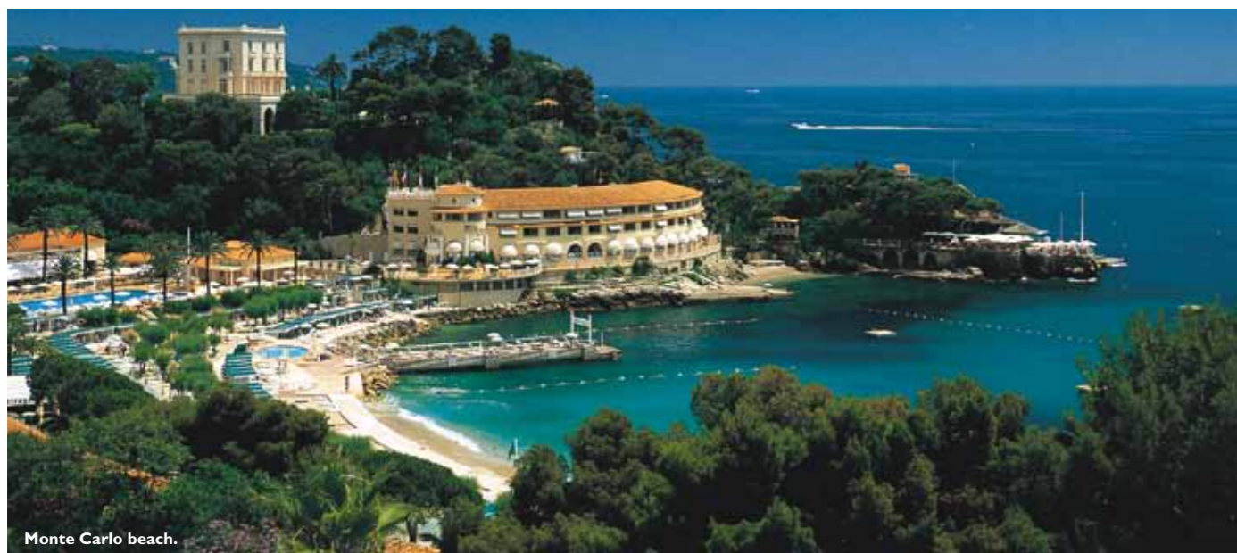
Monte Carlo beach.

om stranden Larvotto och sommarkasinet ligger Monte-Carlo Beach Hotel med en stor privat strandanläggning. Den och alla tennisbanorna intill ligger faktiskt på hyrd fransk mark. Monacos egen golfbana ligger ovanför medeltidsstaden La Turbie, på Mont Agel 900 meter över havet. I närheten ligger furstefamiljen Grimaldis sommarställe och det var här uppe Princess Grace (Kelly) omkom när Stephanie körde av vägen. Banan skapades redan 1911 och renoverades 1933. Utsikten är otrolig men om det är mulet kan man t o m få uppleva att man spelar ovanför molnen. Nere i Monte-Carlo erbjuder stjärnkockarna på Hôtel de Paris och Hôtel Metropole himmelska smakupplevelser.