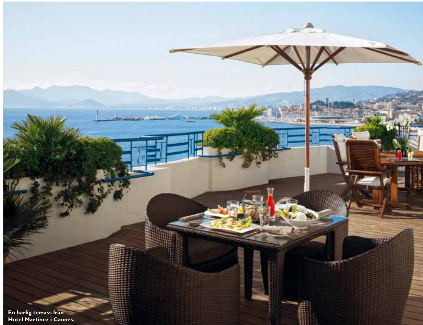
En härlig terrass från Hotel Martinez i Cannes.

Ett av Interhomes utbud nere på Franska Rivieran. Där möjligheten finns att hyra både slott och vingård.