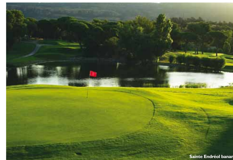
Sainte Endréol banan.

Rika och berömda har alltid älskat Rivieran. Extra kändistätt är det under Monaco Grand Prix och Filmfestivalen i Cannes i maj.